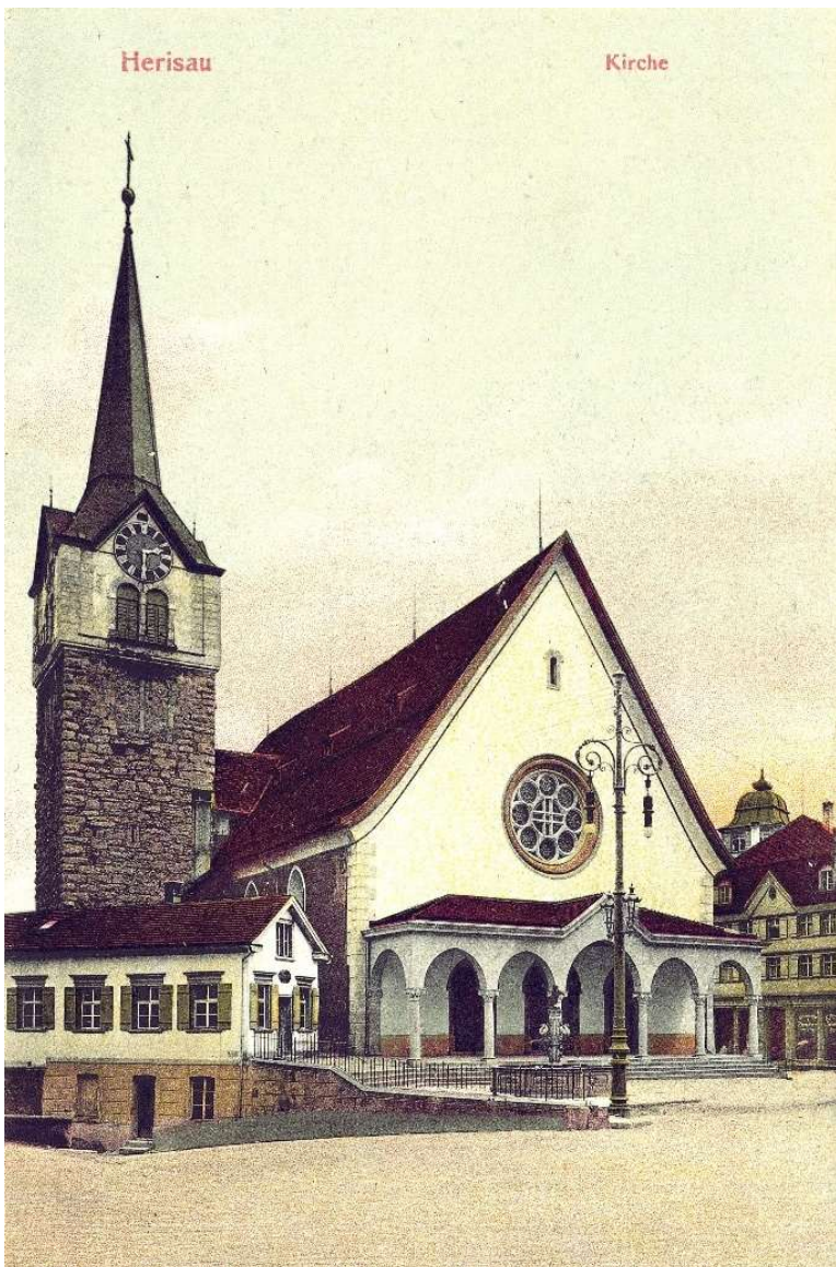
Platz, um 1910

Ausstellungen mit alten Ansichten von Herisau haben seit der Gründung unseres Museums Tradition. Vom ältesten Stich aus dem Jahr 1642 bis hin zu Fotos aus der intensiven Bauphase der 1960/1970er-Jahre zeigte die Ausstellung eine Auswahl aus dem grossen Fundus der Museumsammlung. Vielseitige Einblicke in die bauliche und wirtschaftlich Entwicklung der Gemeinde wurden möglich.