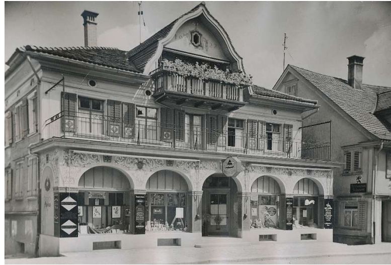
Drogerie Alpina, Kasernenstrasse, um 1960