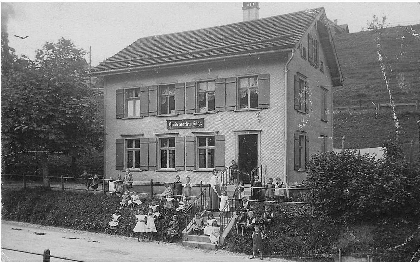
Kindergarten Säge, Herisau, 1909